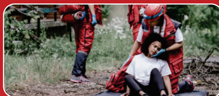
Atendimento de Emergência